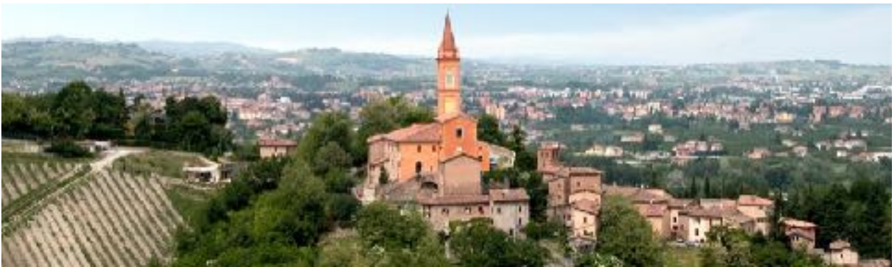
Savignano, immagini HD